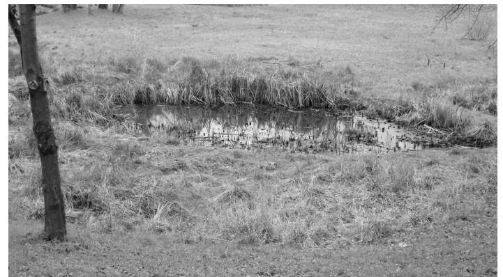
L'étang des Damoiseaux à Igny / Bièvres

- Notre étang du Soleil d'Antony devrait alors évoluer vers une zone dite « humide », composée de hautes herbes et d'arbustes, qui sera partiellement inondée les jours de grandes pluies. Un exemple d'une réalisation similaire : l'étang des Damoiseaux à Igny / Bièvres.