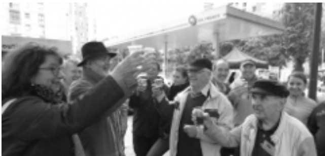
« le départ de la station-service fantôme fêté en grande pompe »

Autres particularités de la Foire à Tout AHQP, le traditionnel apéritif musical a été animé par le quatuor de tubas « Mèkhanè », de renommée nationale ; et le journal « Le Parisien » s'est spécialement déplacé à cette occasion pour préparer un article sur la station Oil France, publié le lendemain dans son supplément régional 92.