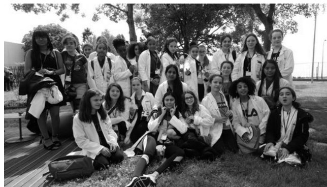
Le 15 juin dernier, sur le Campus Nokia de Nozay

Greenlight for Girls (G4G) est une organisation née dans la région bruxelloise et qui a essaimé à travers le monde. Son but est de promouvoir auprès des femmes de tout âge des domaines traditionnellement ou culturellement dévolus aux hommes : sciences, mathématiques, ingénierie, technologie. Voir greenlightforgirls.org (site malheureusement uniquement en anglais)