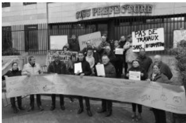
Pétition remise au sous-préfet. Photo Le Parisien 15/11/2018

Les riverains s'en sont inquiétés vivement durant l'été 2018 et un rassemblement d'environ 250 personnes a eu lieu place Fontaine Michalon le 22/09/2018, avec un mot d'ordre « Stoppons le projet SNCF Réseau » soutenu par 1500 pétitionnaires . « Pas de travaux sans informations préalables » a été redit au Sous-Préfet d'Antony.