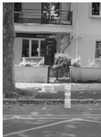
arrêt Jean Mermoz côté pair