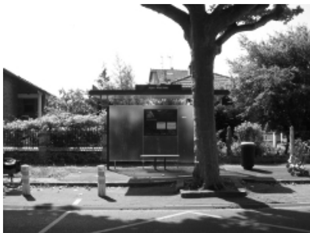
arrêt Jean Mermoz côté impair