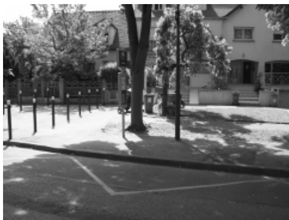
arrêt Le Breuil côté impair (et on s'y mouille par temps de pluie !)