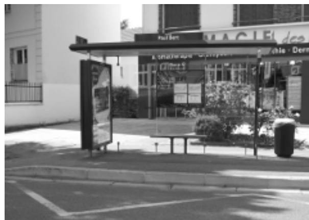
arrêt Paul Bert côté pair