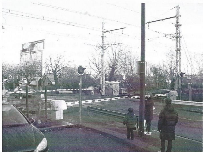
Le PN 9 classé « préoccupant » par RFF

Par rapport au projet RFF 2003, la principale différence technique du projet 2011 est l'utilisation de l'emprise que la RATP se réservait pour une éventuelle 3e voie RER B entre Les Baconnets et Massy-Verrières. Cette nouvelle disposition évite l'élargissement de la plateforme ferroviaire et rend inutile la construction d'un mur de soutènement au ras de la rue des Chênes. On note aussi que le projet 2011 intègre la suppression du PN 9.