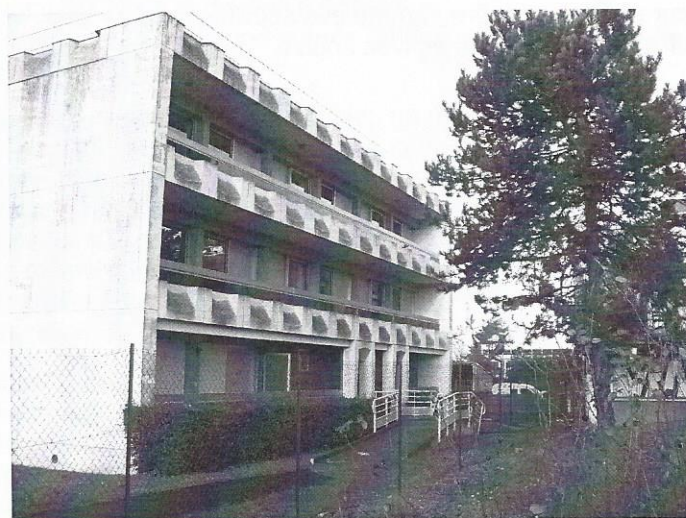
Espace temporaire pour certaines associations

L'immeuble des Associations prévu place des Anciens Combattants devrait être finalisé en décembre 2013. Les baraques actuelles vont être démolies. Certaines associations qui les occupaient ont été temporairement installées dans les logements de fonction à côté de l'IUFM Val de Bièvre.