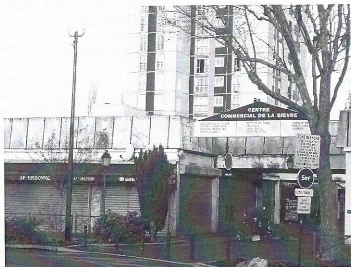
Des rideaux fermés au centre commercial de la Bièvre

compliquée par l'existence de deux syndics : Sagéfrance (côté boulangerie et pharmacie) et Foncia (côté Poste et ancienne mairie annexe). Pour l'AHQP, le départ de commerces importants (ces derniers mois : l'unique libraire et le principal café du quartier) peuvent déstabiliser le centre commercial et plus largement la vie de notre quartier. La mairie est disposée à préempter l'achat de commerces, de préférence les murs, afin de maintenir certaines activités et de pouvoir en fixer librement les loyers : « quand l'initiative privée ne fonctionne plus, la Mairie doit s'en mêler ».