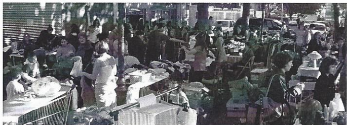
Un parvis animé !

2011 fut un très bon cru. Il y a eu, certes, un peu moins d'exposants qu'en 2009, année de référence, mais avec des étalages plus longs, la recette a été meilleure. Rappelons que la recette de la Foire à Tout constitue la plus grande partie de notre budget annuel. C'est cette manifestation qui nous finance l'impression du « Castor » que vous avez dans les mains : nous le diffusons ensuite dans les 3400 foyers de notre quartier. Merci au cordonnier et à Bacosol qui nous aident régulièrement pour collecter les bulletins d'inscription.