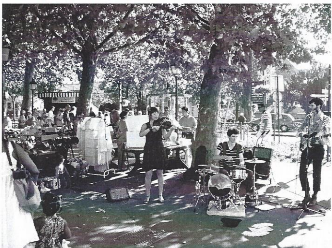
Le trio « intO the mOOn »