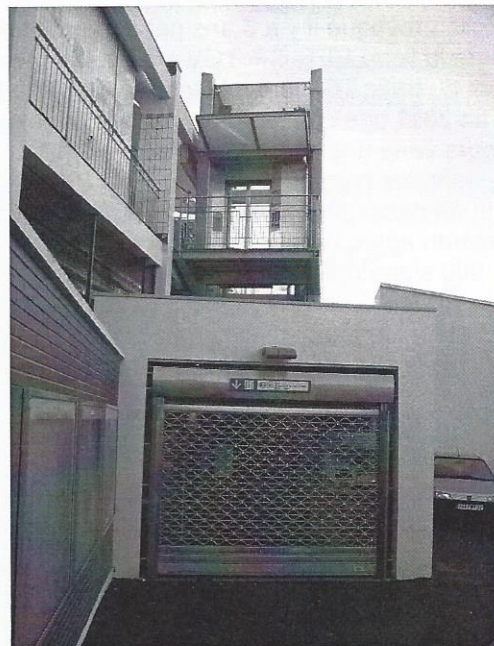
Côté rue Pierre Vermeir, à quand la mise en service ?

Et celui du côté de la rue Pierre Vermeir ? Il semble prêt à nous accueillir. Eclairé en permanence, l'automate à billets attend ses clients, derrière les grilles désespérément fermées. De temps à autre, des ouvriers s'affairent et on prend espoir. Puis les grilles se referment à nouveau. Trois ans de retard.