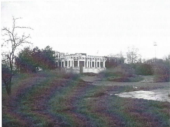
Quels projets sur les terrains de l'ex-IUFM ?

L'IUFM (Institut Universitaire de Formation des Maîtres) Val de Bièvre, est maintenant fermé depuis la rentrée universitaire 2010 par décision de son Ministère de tutelle. Le site qui appartenait au Conseil Général des Hauts-de-Seine a été racheté par la Mairie d'Antony. Il est maintenant voué à un projet immobilier encore peu connu des habitants du quartier, mais bel et bien « mis sur les rails ».