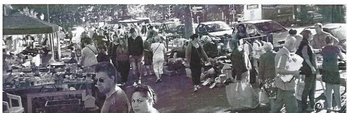
Et sur le parking

Comme tous les ans, nous avons offert aux exposants le café à 10h, l'apéritif à midi et à nouveau le café l'après-midi. Ces trois services de boissons constituent apparemment une particularité de notre brocante qui étonne toujours les nouveaux exposants.